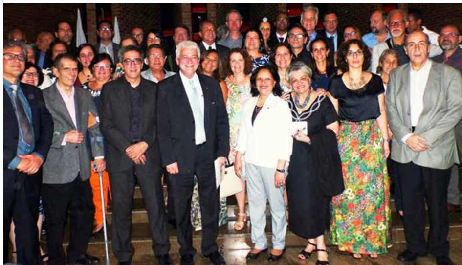
Os Diretores das Unidades Acadêmicas tomaram posse em cerimônia realizada no dia 1º de Março